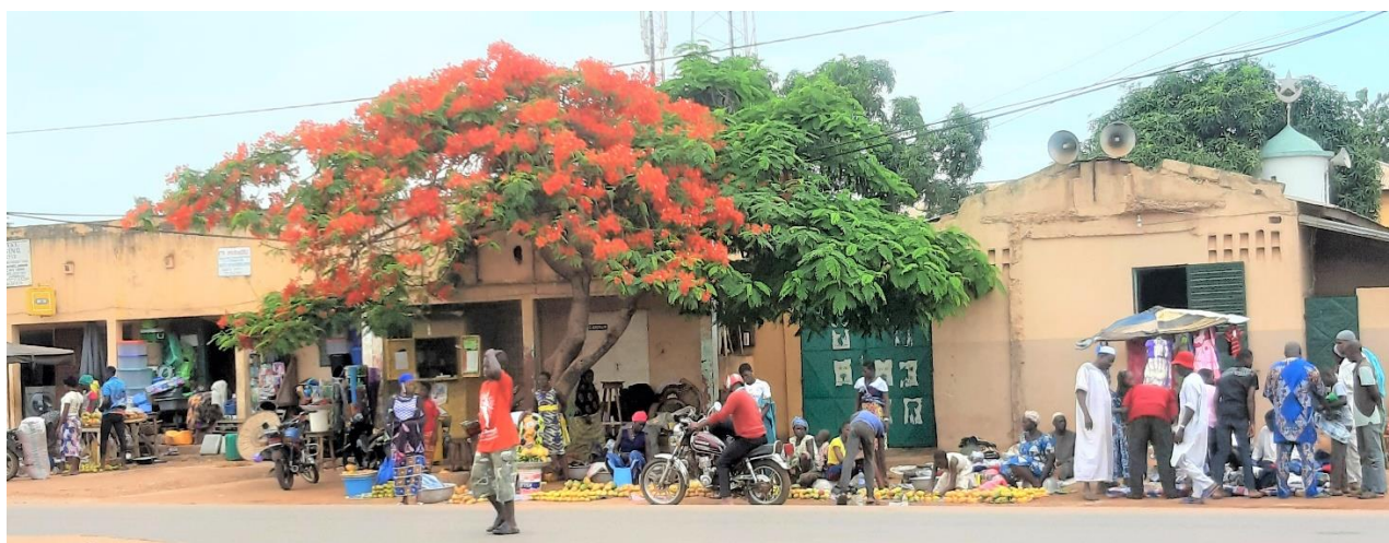
Rue principale de Natitingou

En août 2020, cinq villageoises réparties dans 4 arrondissements ont suivi la formation de base du module Maternité désirée. Après avoir elles-mêmes expérimenté pendant 6 mois la méthode de contraception naturelle, elles ont suivi une deuxième formation en février 2021 pour devenir formatrices de ce module. Elles vont ainsi enseigner dans les villages reculés de leur région à la grande satisfaction de la population.